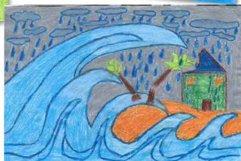
Dessins des classe de 7 e